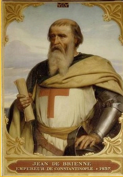
Akkâ Kralı Jean

İsmen Kudüs kralı unvanını taşıyan Akkâ hakimi Jean de Brienne , bu büyük kuvvetten faydalanmak istedi.