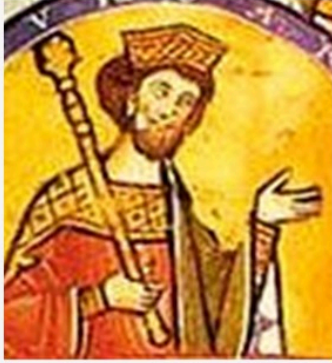
Macar Kralı Andreas

Papa III. Honorius sefer hazırlıklarını devam ettirdi.