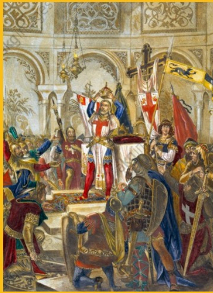
II. Friedrich Kudüs'te kendisini taçlandırıyor

17 Mart 1229'da Friedrich Kudüs'e girdi.