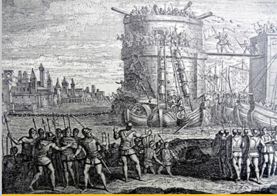
Haçlılar Dimyat Önündeki kuleyi kuşatıyor

Önce limana girişi engelleyen Dimyat önündeki kuleyi zapt ettiler (24 Ağustos 1218).