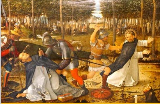
Haçlılar Hıristiyan Katharları katlediyor. (Giovanni Bellini'nin 16.yy. çizimi)

1209'da papanın emriyle Citeaux başrahibinin idaresindeki Hıristiyanlar, Albililere karşı saldırıya geçtiler; cinsiyet, yaş ve mevki farkı gözetmeden herkes öldürülüyordu. Hıristiyanı Hıristiyana öldürten bu savaş 20 yıl sürdü.