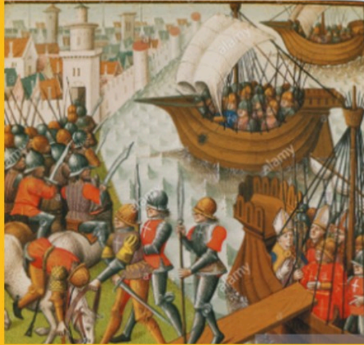
Papanın elçisi Kardinal Pelagius Dimyat'ta karaya çıkıyor (15. yy. minyatürü)

Eylül ortalarında, Papa Honorius tarafından hazırlanan ve başında İspanyol asıllı Kardinal Pelagius'un bulunduğu çoğunluğu Fransızlardan oluşan yeni Haçlı birlikleri geldi.