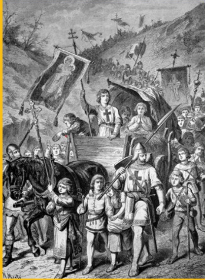
Çocukların Haçlı Seferi, 1212.

Öte yandan Avrupa'da aralıksız sürüp giden Haçlı Seferi propagandaları Çocukları bile etkilendi. Sonunda Fransa ve Almanya'dan binlerce çocuk kutsal toprakları kurtarmak iddiasıyla yollara döküldü.