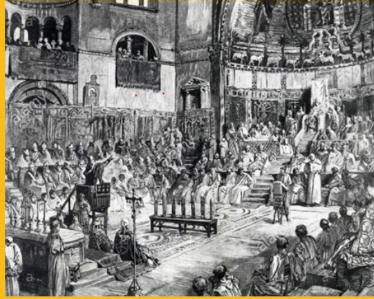
1245 Lateran Konsili

Bu arada Haçlı Seferi hazırlıkları devam ediyordu.