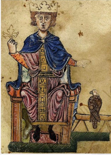
II. Friedrich (13.yy. minyatürü)

Friedrich'in 8 Eylül'de yola çıktı, ama demir aldıktan kısa süre sonra hastalanınca kendisi İtalya'ya geri döndü. Donanması ise Akkâ'ya doğru yola devam etti.