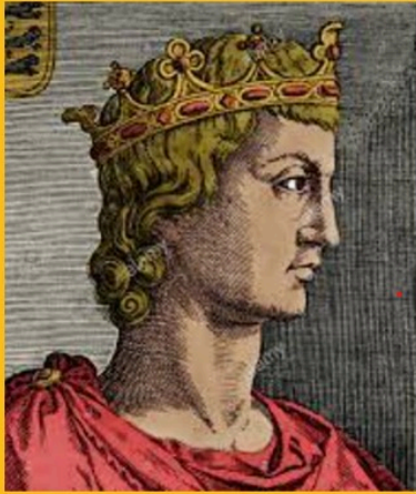
Kutsal Roma Germen İmparatoru II. Friedrich (1120-1250).

Bu sırada 31 yaşında olan imparator, Roma'nın üstünlüğünü kabul etmiyordu.